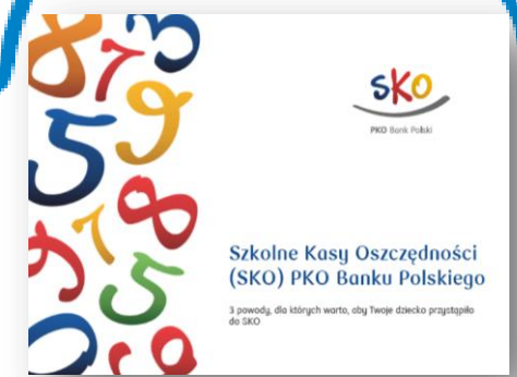
Promowanie SKO na wywiadówkach