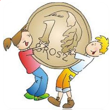
Zachęcanie uczniów do udziału w programie